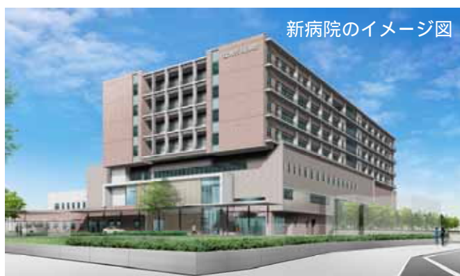
新病院のイメージ図

(*1)「ユニバーサル」とは普遍的な、全体的なという言葉で示され、すべての人のためのデザインを意味します。また、年齢などにかかわらず、できるだけ多くの人々が利用可能であるようなデザインをいいます。