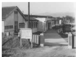
昭和 29 年当時の枚方市民病院

新病院は地上 7 階、地下 1 階の建物で、延べ床面積は約 3 万 1700 m 2 、病床数は 335 床です。施設は免震構造を取り入れ、災害時の医療スペースを確保するほか、ユニバーサルデザイン(*1)を採用し、省エネ・緑化など環境への配慮にも取り組み、市民の皆さんが快適な環境で質の高い医療を受けられるよう配慮しています。新病院は平成 25 年度の開院をめざしてお