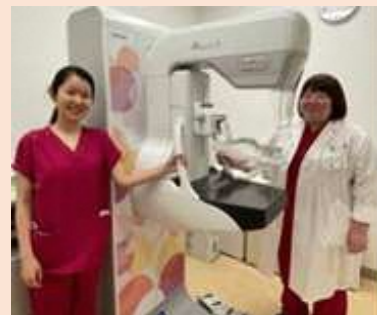
マンモグラフィ検査（月～金）：当院のマンモグラフィ撮影技師は全員女性です