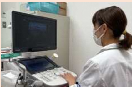
乳腺超音波検査（月～金）：外来担当医師がその場で検査します

月曜から金曜まで毎日外来を行っておりますので、気になることがございましたらお気軽にご相談ください。