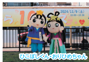
ひら10くんおひめちゃん