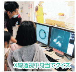
X線透視中身当てクイズ