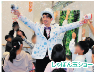
しゃぼん玉ショー