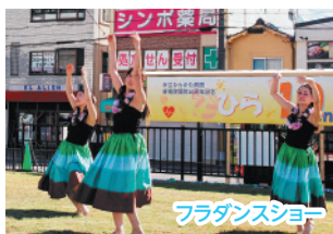
フラダンスショー