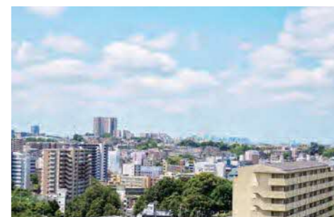
緩和ケア病棟のベランダからひらかたパーク方面を望む

がんを抱えた患者の皆様に、その人らしさを大切に環境で過ごしていただくため、緩和ケア病棟では痛みなどの症状の緩和や精神的なケアを行い、ご家族との時間を大切に緩和医療を実施しています。