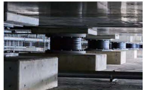
積層ゴム(ダンパーで地震の衝撃を吸収)

複数の受電設備やバッテリー装置、非常用電源等により、災害時においても電力を継続して安定供給できるようになっています。